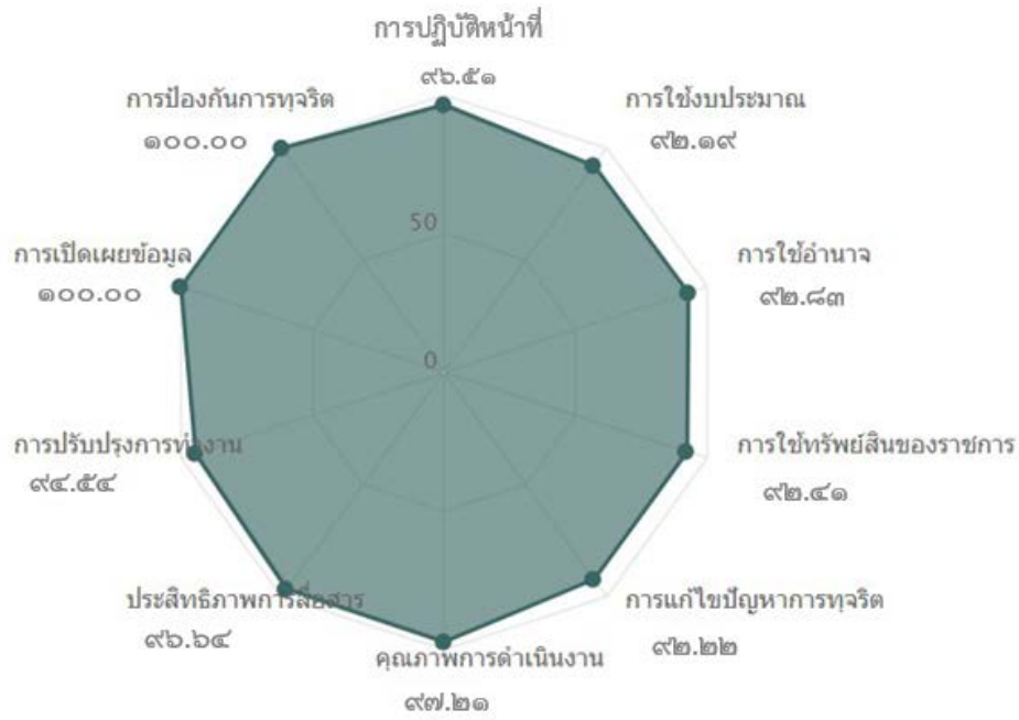
ภาพที่ ๑ กราฟแสดงผลการประเมิน ITA จำแนกรายตัวชี้วัด ของกรมพัฒนาที่ดิน ประจำปีงบประมาณ พ.ศ. ๒๕๖๕